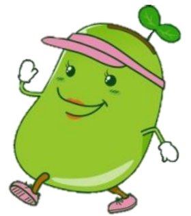
元氣じゃけんひろしま 21 マスコットキャラクター「そらママ」