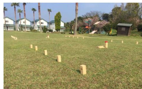
★大会会場 グリーンガーデン

◆JRでお越しの方は、山陽本線大島駅下車、 駅から会場までは送迎バスをご利用ください。(要予約)