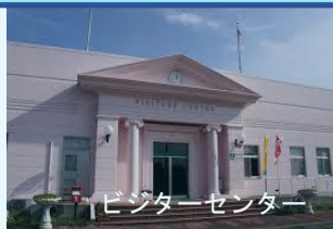
ビジターセンター

少し早めにお越しいただき、グリーンスティながうらの施設や周辺のロケーションをお楽しみください。