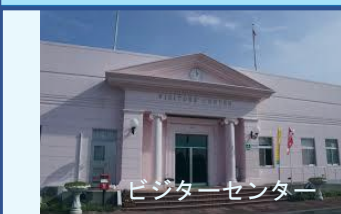
ビジターセンター

少し早めにお越しいただき、グリーンスティながうらの施設や周辺のロケーションをお楽しみください。