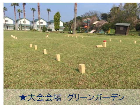
★大会会場 グリーンガーデン

JRでお越しの方は、山陽本線大島駅下車、 駅から会場までは送迎バスをご利用ください。(要予約)